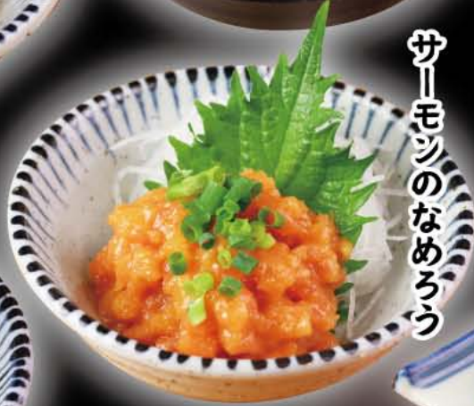
サーモンのなめろう