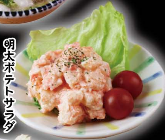
明太ポテトサラダ