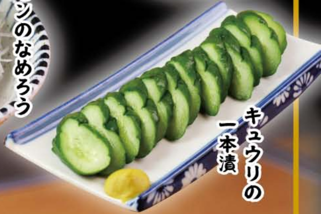
キュウリの一本漬